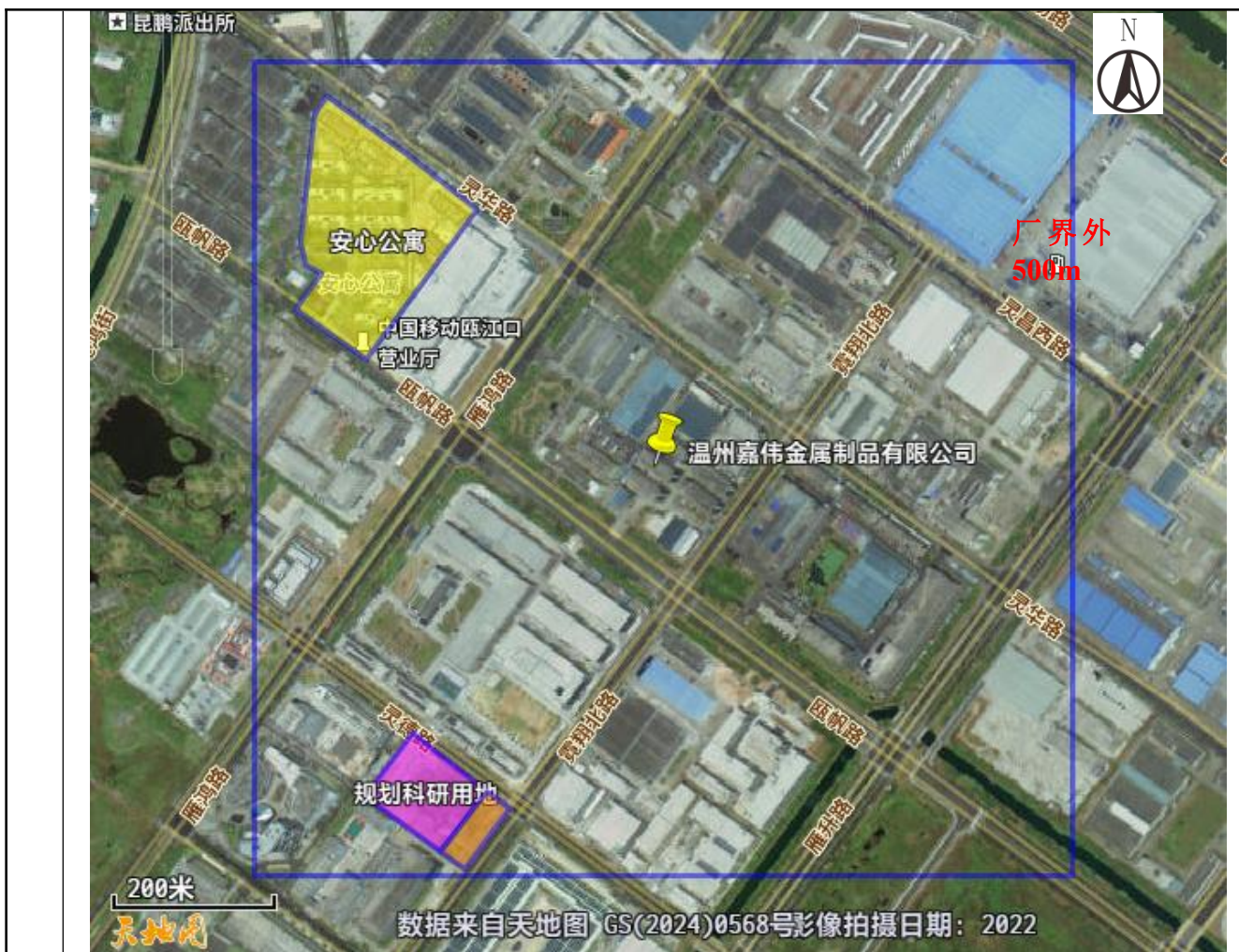
图 3-3 项目所在区域周边环境保护目标（厂界外 500m）